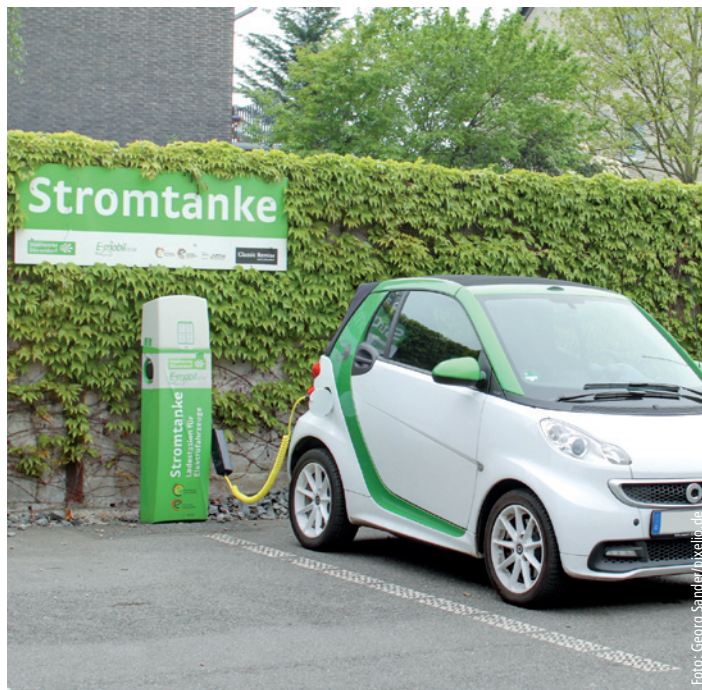
Steuerliche Vergünstigungen: Vom Arbeitgeber gewährte Vorteile für das Aufladen eines privaten Elektrofahrzeugs sind von der Einkommensteuer befreit.

Die meisten Maßnahmen zur Elektromobilität sind bis 2020 befristet. Gerade für Unternehmer kann der Zuschuss zur Einrichtung einer Ladevorrichtung im Betrieb interessant sein, auch um ihren Arbeitnehmern einen attraktiven Anreiz zu bieten. Ein Steuerberater hilft Ihnen dabei herauszufinden, ob und inwiefern sich das (bzw. auch andere Vergünstigungen für Ihre Mitarbeiter) für Sie lohnt.