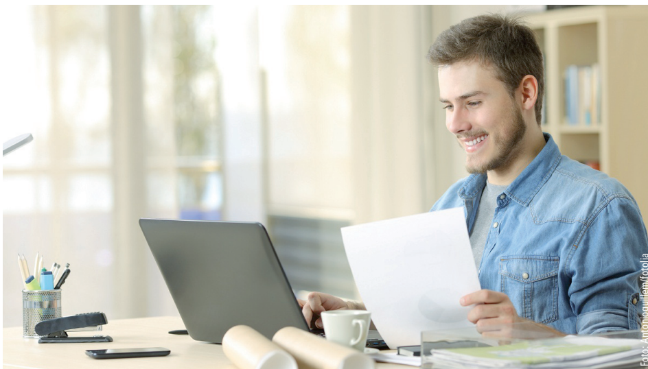
Stress mit dem Finanzamt vermeiden: Gut lachen hat, wer einige Regeln zum Arbeitszimmer daheim beachtet.

☞ Mögliche Lösung: Bei der Wahl des Arbeitszimmers sollten Sie sich nicht für den größten Raum der Wohnung entscheiden. Die Ausstattung sollte büromäßig sein und nicht auf eine