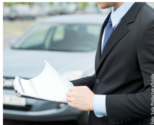
Lieber vorher nachschauen: Was genau beim Thema Dienstwagenüberlassung gilt, geht oft aus dem Arbeitsvertrag hervor.

Hierzu zählt, dass der Anspruch auf die Kraftfahrzeugüberlassung aus dem Arbeitsvertrag oder aus